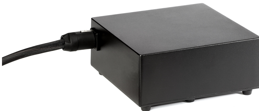
Abbildung 2: Verstärkernetzteil

Beginnen Sie mit der Verkabelung des Eingangs des Verstärkers. Nehmen Sie dazu das beiliegenden symmetrisch ausgeführten XLR Verbindungskabel oder ein vergleichbares Ihrer Wahl. Die beste Verbindung zwischen Ihrer Signalquelle, Ihres Vorverstärkers ist eine symmetrische XLR Verbindung. Falls Ihre Signalquelle, Ihr Vorverstärker aber nur über asymmetrische Ausgänge verfügt