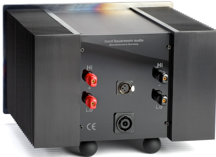
Abbildung 1: Rückansicht des Verstärkers

Die folgenden Bilder zeigen die Rückansicht des Verstärkers mit seinen Anschlüssen und das zugehörige Netzteil: